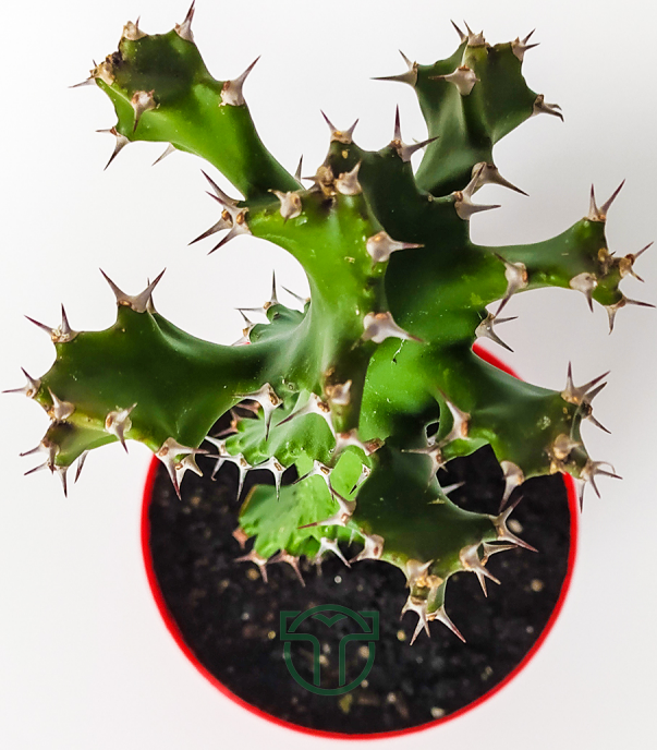
Euphorbia Tortilis Çoğaltma[/caption]

çoğaltma işlemi yapabilirsiniz. Kesilen dalları altında kalacak şekilde dikimini yapınız. " width="400"]