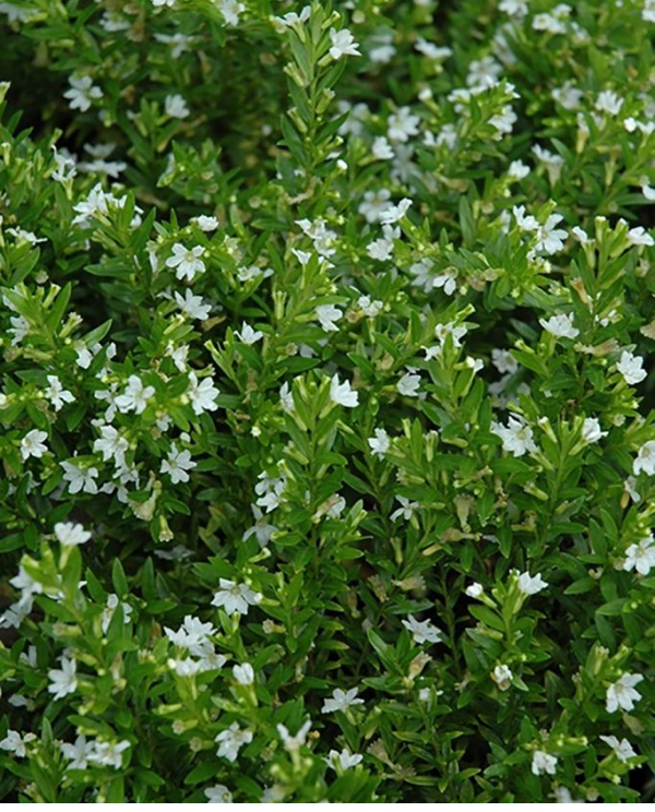
Cennet Çiçeđi Kufeya beyaz Cuphea[/caption]