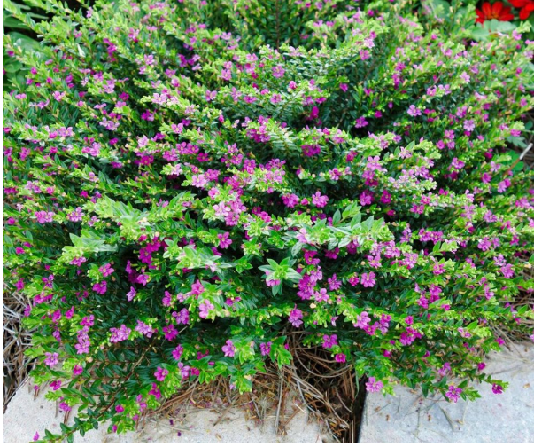
Mor çiçekli cennet çiçeği[/caption]