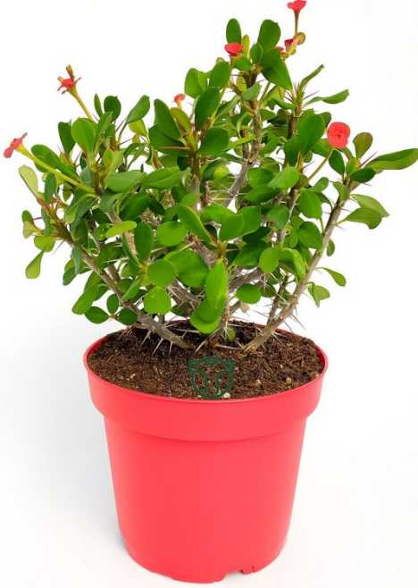
Dikenler Tacı Euphorbia Miili Kırmızı Çiçekli[/caption]

Dikenler tacı bakımı oldukça kolay olan bitkilerden biridir. "Yılbaşı dikenli, kral tacı, gelin kaynana çiçeği, dikenli taç" isimleriyle de bilinen dikenler tacı (Euphorbia milii) bitkisi evde bir. Dikenler Tacı (Euphorbia milii) gövdesi dikenli bir ni kendini korumak değil, su tutma ve güneşe ulaşmak için çalı formundaki dalları, yaprakları ile birlikte 2 metreye