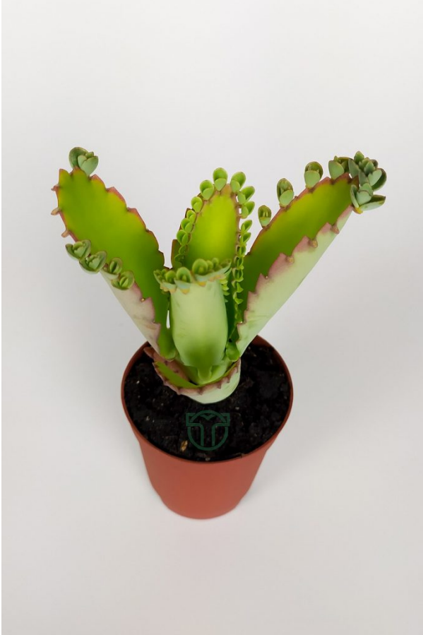
Aşkın Gözyaşları Çiçeği bakımı[/caption]

ı bir türüdür. Hatta bir kere ektiğiniz zaman ondan bir daha ölü yapraklarından binlerce kez çoğalabilir. Dolayısıyla nemli toprakta filizlenmeye başlayan yavruları temizlemenizi unutmayın. [attachment_2395" align="alignnone" width="300"]