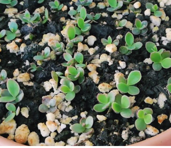
Aşkın Gözyaşları nasıl çoğaltılır?[/caption]